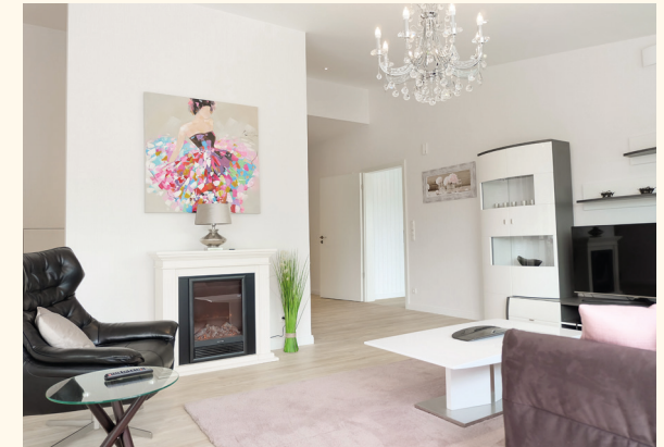
Musterwohnung: Wohnzimmer mit offener Küche